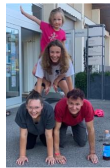
Eindrücke aus dem Jahr 2023