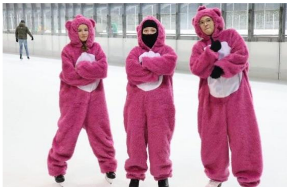
Eislaufen am Teamweekend

statt und findet grossen Anklang. Gerne möchten wir noch mehr Kinder mit unseren Angeboten erreichen. Dazu gestalten wir die Programme spannend und abwechslungsreich. So machen wir im nächsten Semester z.B. einen Ausflug zu einem Virtual-Reality Game, auch dürfen die 6. Klässler:innen bereits einmal zu Besuch im Jugendtreff kommen oder am Summer Beach Camp teilnehmen.