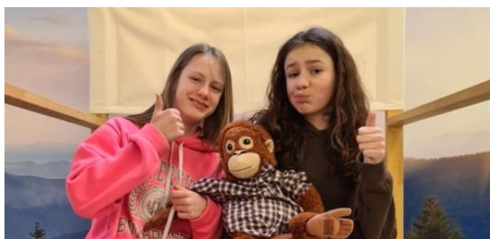
Einkaufen - Urs der Affe musste mit